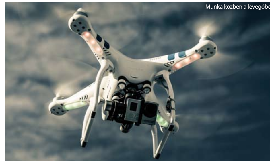
Munka közben a levegőben

Az új parlamenti és tanácsi rendelet kihirdetésére még az idén sor kerülhet, a részletszabályok hatálybalépése pedig a jövő évtől folyamatosan várható. A kihirdetést követően a tagállamoknak jogharmonizációs kötelezettségük keletkezik, vagyis a jelenleg alkalmazott szabályrendszer az európai uniós kötelezettségekhez kell igazítaniuk, a megfelelő viszont országoként eltérő időpontban valósulhat meg.